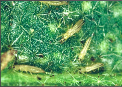
ミカンキイロアザミウマ